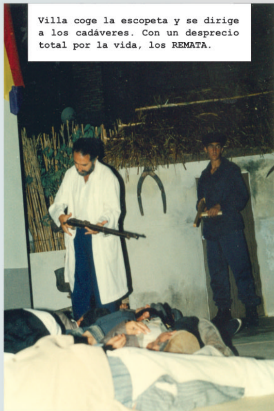
Villa coge la escopeta y se dirige a los cadáveres. Con un desprecio total por la vida, los REMATA.

Gracias, señor. Le felicito, capitán. Esto se podría haber evitado. Nosotros somos militares, NO ASESINOS. El Gobierno estará muy orgulloso con usted. ¡Ha cumplido con su deber!